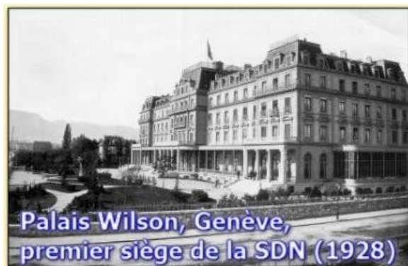
Palais Wilson, Genève, premier siège de la SDN (1928)

Au cours du traité de Versailles est créée la Société des Nations (SDN - organisation internationale) dont le but est de conserver la paix en Europe. Le déclenchement de la Seconde Guerre mondiale démontrera que la SDN a échoué dans son objectif primordial d'éviter toute nouvelle guerre mondiale. La SDN sera remplacée par l' ONU en 1945.