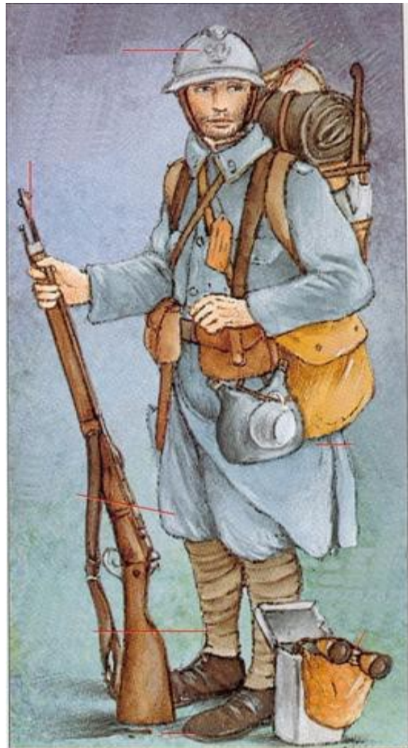
Poilu de 1915

Doc 4 : un ..... Complète la légende de ce poilu : un casque en tôle et cuir appelé Adrian , un fusil Lebel au tir plus rapide, une veste de drap, un barda de plus de 20 kg, un pantalon bleu horizon , des bandes molletières , un masque à gaz , des godillots cloutés