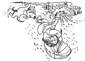
Moyenne des précipitations et températures annuelles en Bretagne