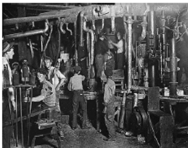
Dans une usine de verre d'Indiana (Etats-Unis).

Dans les mines : Leur petite taille leur permettait de se glisser dans les galeries les plus étroites. Ils poussaient des wagonnets remplis de charbon, au risque de se faire écraser quand, à bout de force, ils ne pouvaient plus retenir la lourde charge.